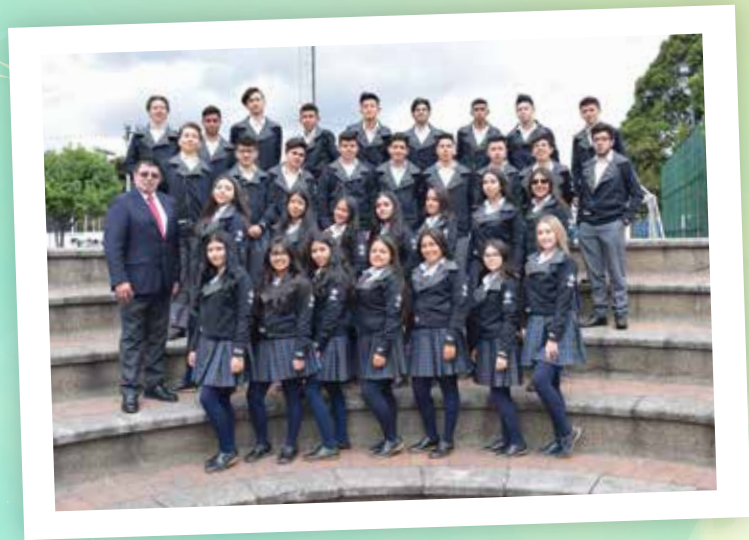
1104 - Dir. Luis Horacio Arias