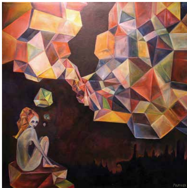
Referencia de la imagen: Fournier, J. (s.f.) "Camino real al inconsciente".