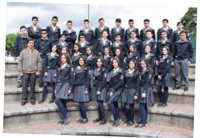
1105 - Dir. Francisco Ramos