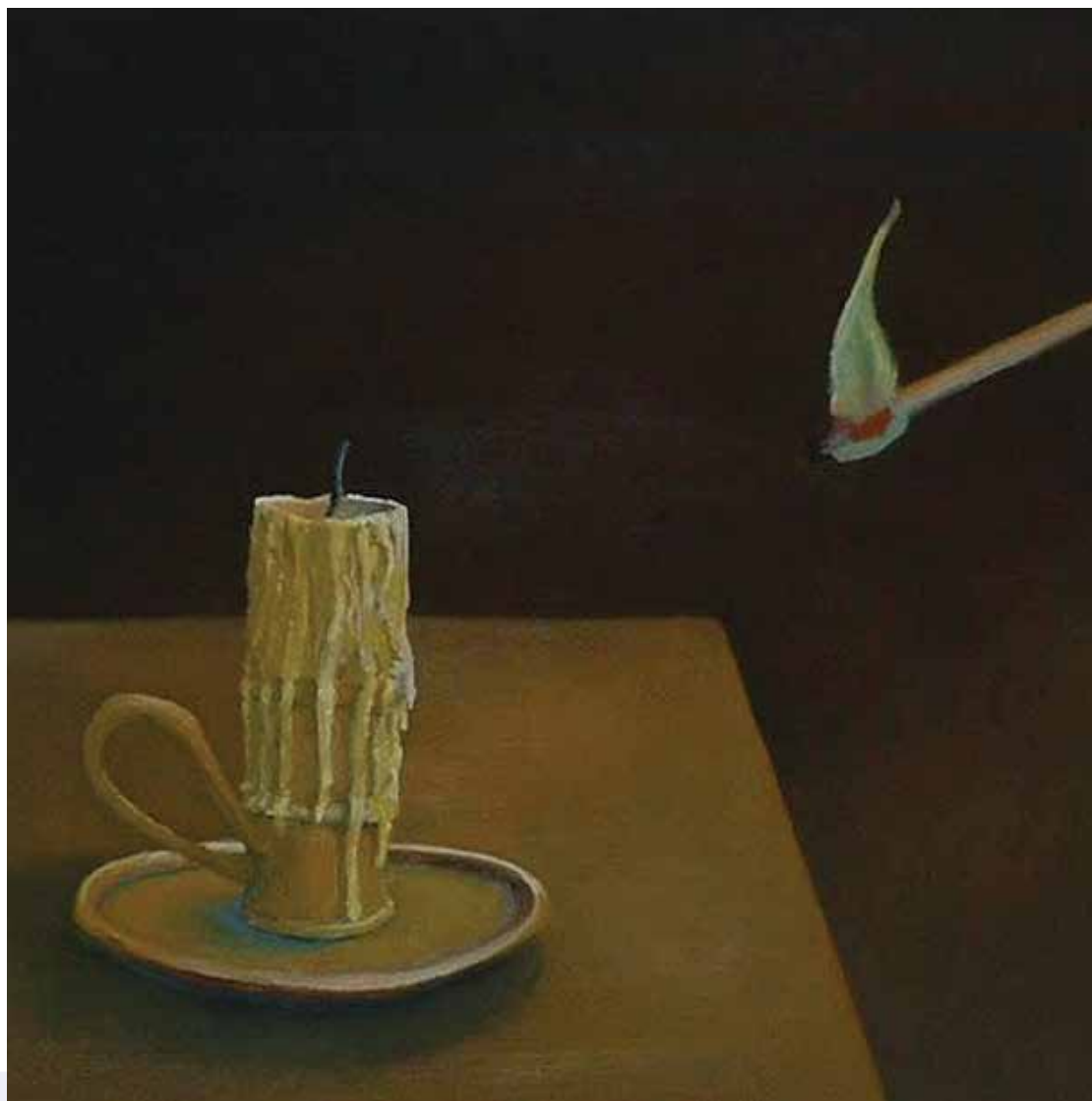
Referencias imagen: Nanduxa (s.f.) "Acendiendo a vela"