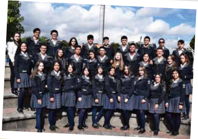
1101 - Dir. Diana Vargas