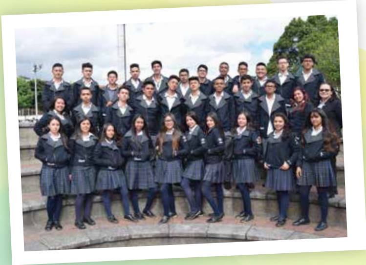
1102 - Dir. Esperanza Beltrán