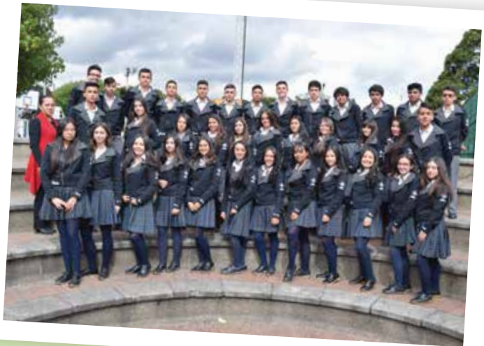
1103 - Dir. Marcela Montaña